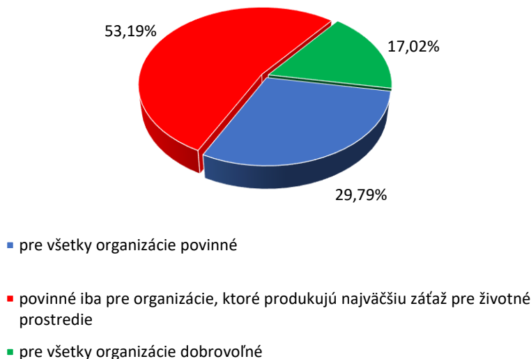
Graf 2 Spôsob zavádzania systémov manažérstva environmentu